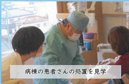
病棟の患者さんの処置を見学