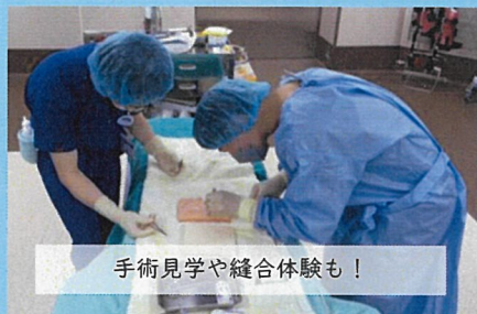
手術見学や縫合体験も！