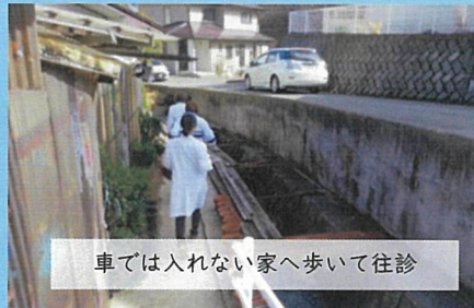
車では入れない家へ歩いて往診

手術や病棟から診療所・介護施設まで、興味関心に合わせた自分だけの実習を担当者と一緒にカスタマイズ！低学年のうちから年間通して参加できます。