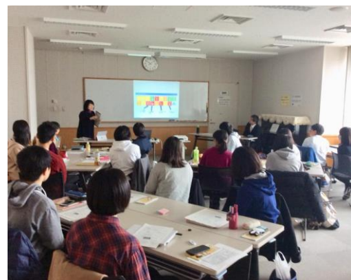
2月16日参加者事前研修（長野市TOiGO）

前々号で「信州つばさプロジェクト」について紹介しましたが、その最初の事業として「SDGs スタディツアーin台湾」が行われます。事業概要には、「長野県教育委員会と連携協定を締結した台湾・高雄市を訪問し、現地の高校生との交流を通して国際理解を深めるとともに、英語でのプレゼンテーション、異文化交流や学習を通じて、国際的な感覚を養い視野を広げる。また、普段は入ることのできない政府教育局や日本台湾交流協会などの公的機関、台湾に支社支店等を置く長野県の企業等を訪問し、現地で活躍する日本人にお話を伺うほか、女性の社会進出が著しい台湾の女性リーダー等にインタビューする機会を設定し、2030年の社会の方向性を考えるSDGsの要素を台湾で学ぶことをねらいとする」となっています。本校からも3名の生徒（全県22名）が参加予定で、20日の昼休みに校長室で懇談をし、視野を広げること、コミュニケーション力を身につけること、同年代と交流すること等々、それぞれ 期待 と 意気込み を語ってくれました。自分の育ってきた環境とは違う、多様で異質な他者に出会う経験を大いに積んできてください。