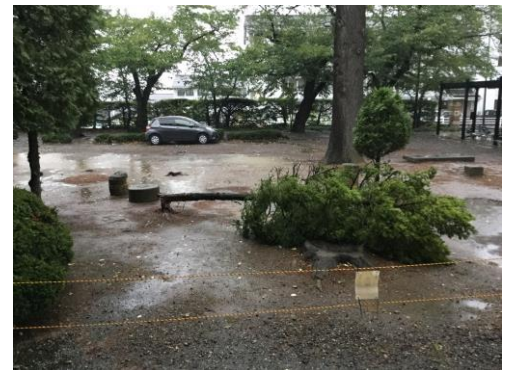
折れた直後の様子

今年は台風の当たり年で、8月だけでも8個の台風が発生しましたが、9月に入ってからますます非常に強い台風 21 号が西日本を縦断、長野県にも大きな爪痕を残しました。特に今回は風が強くて、松本市では午後 4 時 52 分に最大瞬間風速 31.1 メートルを沢村で記録したということですから、まさに深志高校周辺を暴風が吹き荒れたこととなります。恐らくこの時間あたりだと思われませんが、1棟前の木が1本根元から折れてしまいました。また、講堂のガラスが2枚割れていました。他校の様子を聞けば、もっと多くの窓が破損したり、物置が転がったり、トタン屋根が飛んでいたり、との話も聞きます。また、関西では甚大な被害が出ているところもあり、この程度で済んでよかった、と言えるかもしれません。被災された方々が、早く日常を取り戻せることを祈りたいと思います。