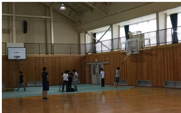
前日の会場準備、委員の他に吹奏楽部、舞装も活躍

いうことで、とんぼ祭の始まる一年前、昭和 22 年の 12 月 4 日、まだ松本中学だった時に初めてクラス対抗合唱コンクールが開催された、と深志 90 年史にはありました。また最初の頃は、クラス対抗とは別にとんぼ祭の中でも合唱コンクールをやっていたようです。とんぼ祭が夏休み後に行われていて、5 日間も 6 日間も延々とやっていた時代の話です。とんぼ祭の合唱コンクールはクラス対抗ではなく、部活や郷