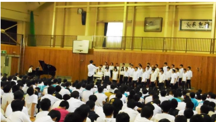
金賞 3 年 4 組

います。午前中は土曜授業を行い、午後 1 時 10 分からスタート、全 24 クラスを移動も含めて 3 時